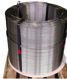
Gespultes Coil Spooled euro coil