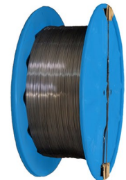
Stahlspule Steel spool

Sowie gerichtete Stäbe | Plus straightened bars