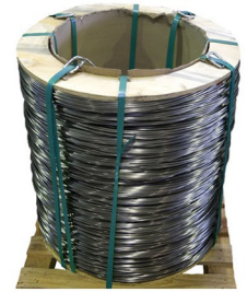
Ring auf Palette Ring on pallet