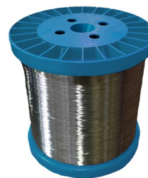
Kunststoffspule Plastic spool