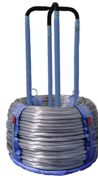
Ring auf Kronenständer Ring on crown carrier